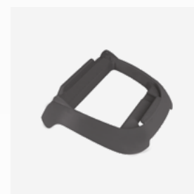
Base per scatola di comando